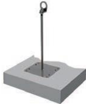
SAFEX ESE - Betondecke

Positionsnummer Positionstext Preisanteile P Z Z V w G K V Menge EH Positionspreis