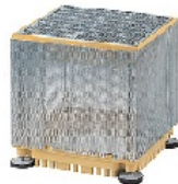
Sita Green für Intensivbegrünung

Liefen und einbauen einer Abdeckung aus Polyurethan, mit feuerverzinktem Endrost (Maschenweite 9 mm x 32 mm, höhenverstellbar von 10-13cm) und Lochblechrahmen. Abmessung 400 x 400 mm Angeb. Fabr.: Sita Green für Intensivbegrünung