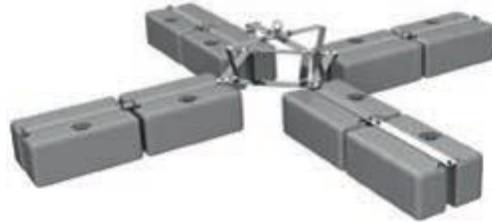
Spider End - Eckhalter und EAP

Positionsnummer Positionstext Preisanteile P Z Z V w G K V Menge EH Positionspreis