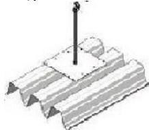
SAFEX ESE TR