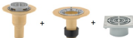
Sita-Compact Schraubflansch senkrecht + Sita-Compact Aufstoc

Angeb. Fabr.: Sita-Compact Schraubflansch senkrecht + Sita-Compact Schraubflansch Aufstockelement + Balkonaufsatz