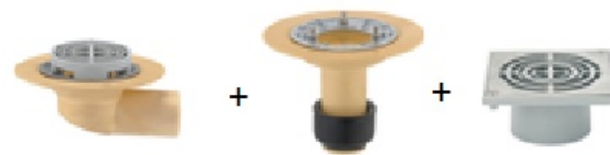
Sita-Compact Schraubflansch abgewinkelt + Sita-Compact Aufst

Liefen und einbauen von Balkongullies, mit Schraubflansch, Aufstockelement und Balkonaufsatz. Geeignet als Hauptentwässerung gem. ÖNORM EN 12056 und ÖNORM B 2501. Dampfsperre und Abdichtung fachgerecht anschweißen und einklemmen. Durchmesser Gully (DN): ..... mm Höhe Aufstockelement: .....-..... mm Angeb. Fabr.: Sita-Compact Schraubflansch abgewinkelt + Sita-Compact Schraubflansch Aufstockelement + Balkonaufsatz