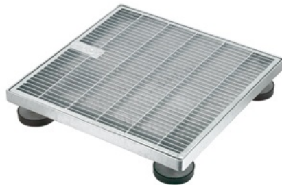
Sita Drain Terra